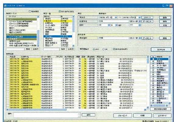
診療情報オンライン検索システム CLISTA! SEARCH