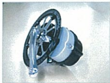
電動アシストユニット「S03」