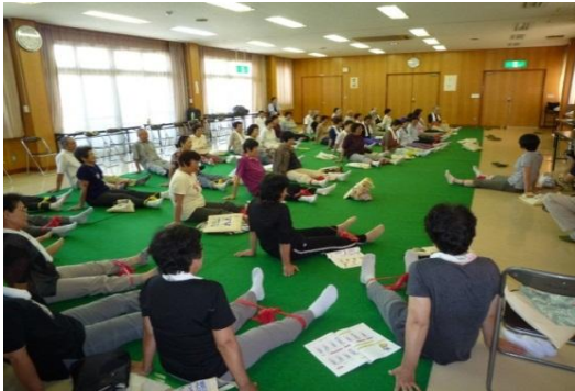
防災対策の一環として下肢の筋力強化を目指した運動を実施