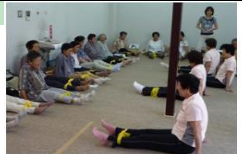
地域の運動推進ボランティアの方と共に運動指導をしている様子