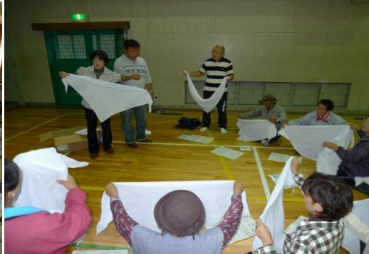
防災対策に関する演習(救急法)