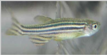
ゼブラフィッシュ (Danio reio) 成魚 (左)

医薬品を含む環境化学物質の安全性測定をするために、ゼブラフィッシュなどのモデル動物を活用し、ゲノムテクノロジーやゲノム情報を基盤としたトキシコゲノミクスに関する研究開発を行っている。