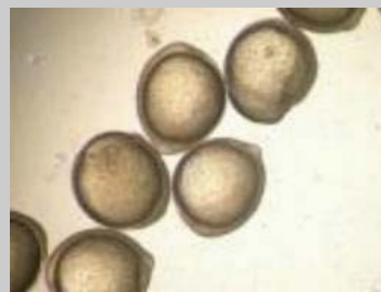
三環系抗うつ薬の影響 未処理 (左)