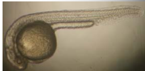
ゼブラフィッシュ (Danio reio) の成魚 (左) と初期発生過程 (右)