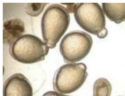
三環系抗うつ薬の影響：未処理 (左)、処理 (右)