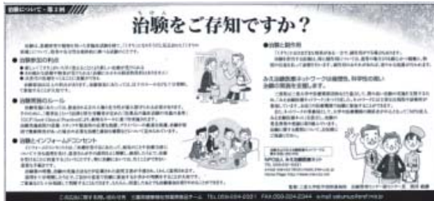
2004年3月23日 主要新聞 三重版