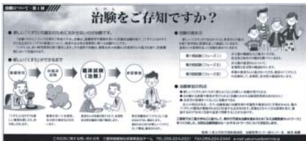
2004年3月18日 主要新聞 三重版