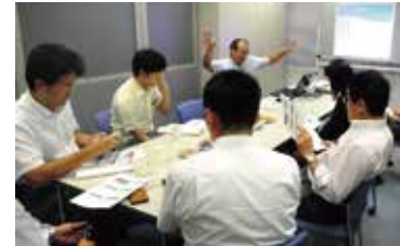
ミーティングスペース