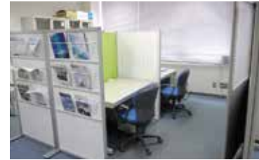
ワーキングスペース