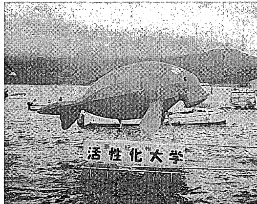
写真 2. 第 6 期生製作のジュゴン燈籠

おり、ミーティングは 10 回以上に及ぶ（より小さな自主的な打ち合わせなどを加えればその回数はさらに増える）。地元こだわりの活動ながら、活性化大学メンバーがいかに熱心に調査活動を行ってきたかが理解できる。