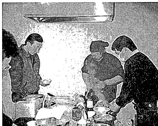
写真3. 創作料理づくり

以上からもわかるように、このOB会は、全体がまとまって何らかの事業を積極的に推進するというよりも、メンバー同士を結びつけるための比較的緩い組織である。時間の経過とともに少しずつ弱まっていくことが避けられない修了生のネットワークをある程度維持したいという思惑が読みとれる。そして第2回のOB会総会は、2004年2月に開かれ、この時は東紀州の素材を生かした創作料理コンテストが行われている（写真3）。